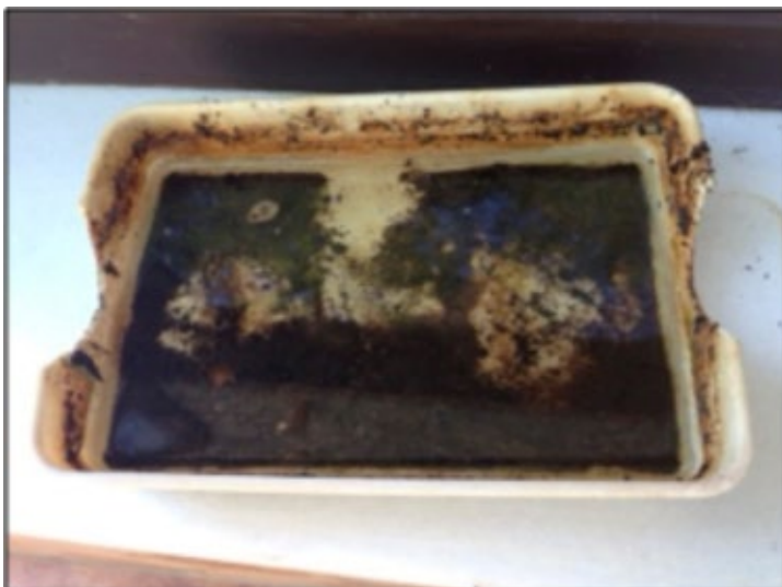
Figura 3. Recipiente donde se detectaron larvas del mosquito tigre.

material entomológico recolectado fue transportado al laboratorio, donde se determinó bajo observación de lupa binocular y en apoyo de las claves de Schaffner et al. (2001), que todos los ejemplares pertenecían a la especie A. albopictus .