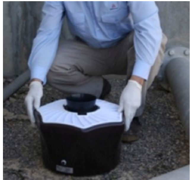
Figura 1: Instalación de trampa BG-Sentinel para la detección del mosquito tigre