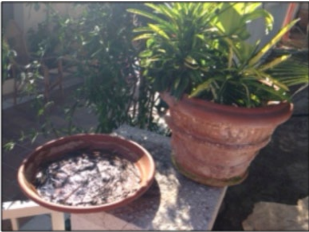
Figura 4. También se colectaron estadíos preimaginales del mosquito tigre en diversos platos que recogen excedentes del agua de riego de macetas.