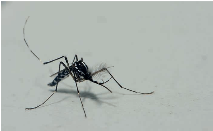
Figura 2. Detall d'un dels mascles del mosquit tigre capturats.

Després de la notificació de diverses queixes ciutadanes, canalitzades a través de l'Àrea de Medi ambient de l'Ajuntament de Dénia, relacionades amb picades per part de mosquits la descripció morfofocromàtica i etològica dels quals a priori podia ser coincident amb l'activitat del mosquit tigre, a l'octubre de 2014 es van realitzar una sèrie d'inspeccions entomològiques mitjançant el suport de safates recol·lectores d'aigua (denominades dippers) i aspiradors mecànics manuals que van permetre la captura d'un total de 4 mascles (Figura 2) i 2 femelles de Ae. albopictus . Tots els exemplars es trobaven en