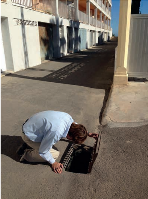
Figura 3. Procés d'inspecció als embornals on es varen detectar exemplars adults del mosquit tigre.

situació de repòs dins d'una línia d'embornals (Figura 3) a la zona de Les Marines (coordenades de la troballa: N 38° 52' 54.9'' / O 0° 01' 58.9''). La determinació taxonòmica del material entomològic capturat es va fer posteriorment en condicions de laboratori i seguint els criteris establerts per SCHAFFNER et al. (2001).